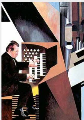
Ausschnitt eines Triptychons von Agostino Raff Postkarte · postcard Carus 40.385/10

Preisänderung, Irrtum und Liefermöglichkeit vorbehalten · Prices are subject to change.